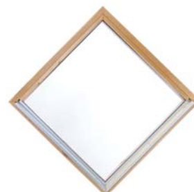
Fönster 601 6x6, snedställt