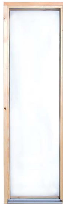
Fönster 601 5x16

2-glas Optifloat Clear 4mm SK, Stålräm 10mm. Total tjocklek 20 mm. Glaslist furu 17x17 mm, aluminiumlist Sapas Elox 26 med tätningslist kronlist EPDI gummi 9x3 mm.